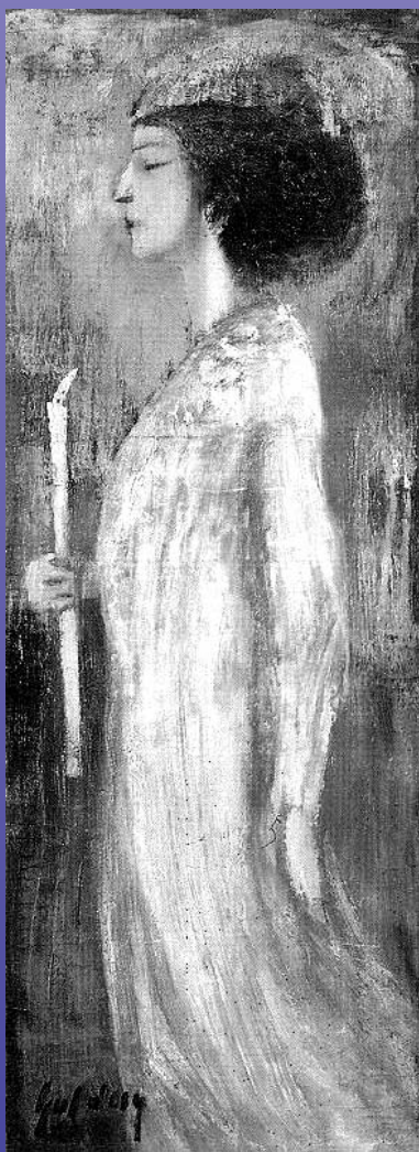
Gulácsy Lajos: Nő gyertyával (1910 körül, pasztell)