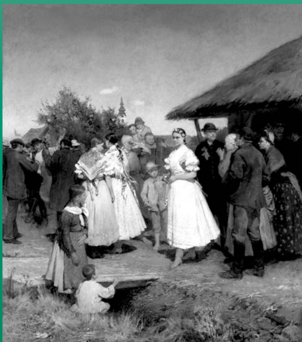
Deák-Ébner Lajos: Esküvői menet 1888

És: nyelvi játékok, új szavak, szómagyarítás