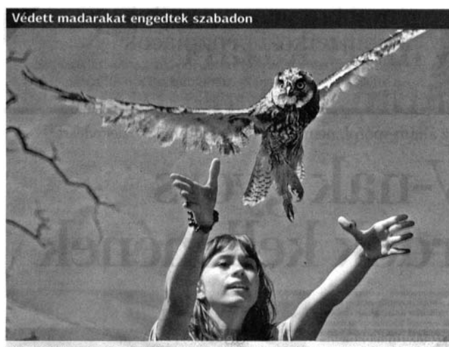
Vörös vércsét, karvajt és fülesbaglyokat engedtek szabadon a Budapest Állatkert munkatársai a Hortobágyon

Ez aztán igazán vegyes bolt! (A képet és kísérszövegét rendszeres cikkíróinktól, H. Varga Mártától kaptuk.)