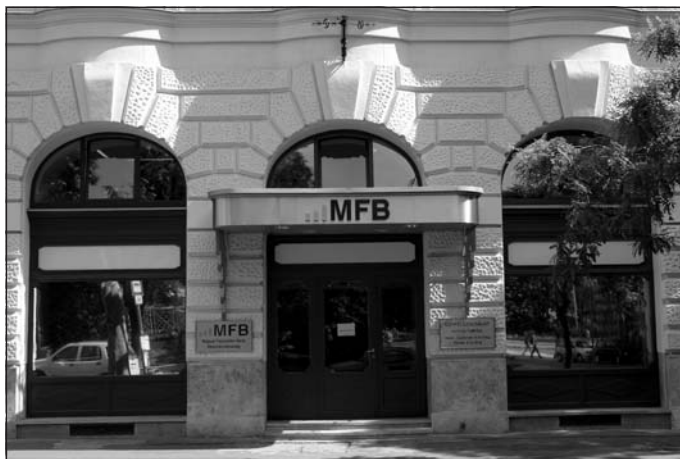
A Magyar Fejlesztési Bank elkötelezetten támogatja a magyar kultúrát

Meggyőződésem, hogy bár fontos az iskola, a legfontosabb mégiscsak a példa. Életmintát, különösen nyelvhasználati mintát pedig a média mutat – mégpedig nem ritkán katasztrofálisat. Nincsen mód büntetni a magyar-talanságot, de igenis figyelmeztethetnek a szerkesztőségek az igényes nyelvhasználatra. Népszerűbbek volnának az anyanyelvi mozgalmak, a versenyek, a táborkok is, ha teszem azt, áldoznának annyi időt a bemutatásukra, mint némely csecsmutató celebekére. Örömmel látnám, ha az igényes nyelvhasználat minél több fiatalat érintene meg. Látványos javulást hozna, ha a közoktatásban visszakapná szerepét az élőbeszéd. Tesztekkel, feladatlapokkal lehet játszani „objektivitást”, viszont ellehetetlenítik a szókinccs gyarapítását, a kommunikációs