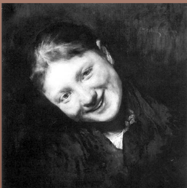
Hollósy Simon: Nevető lány (1883)

És: nyelvi játékok, keresztrejtvény, hírek, események