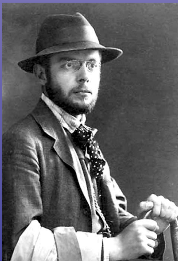
Bartók 1907-ben erdélyi gyűjtőúton (Kováts István, Gyergyószentmiklós)

És: új szavak, események, kiadványok, nyelvi játékok