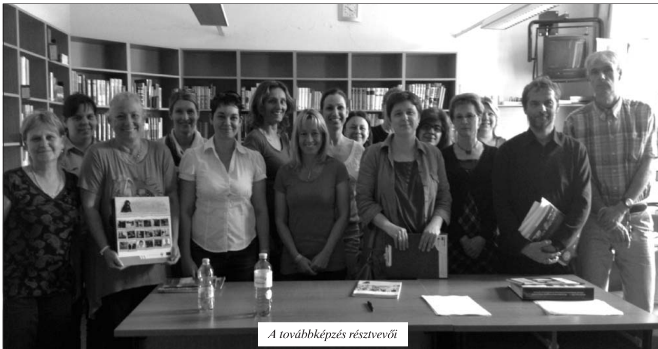
A továbbképzés résztvevői