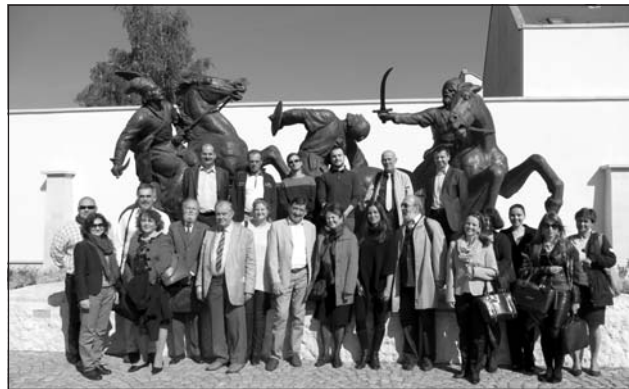
Egri szemiotikusok (Udvariasságkutatók)