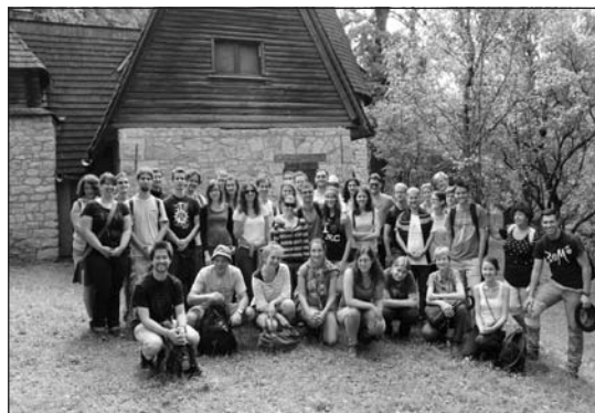
A BOM csapata

További információt a bom@e-nyelv.hu ímélcímen kérhetsz, vagy látogass el a www.bom.hu oldalra.