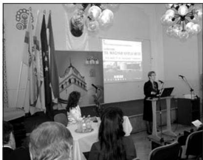
Az 50. magyar nyelv hete megnyitója

Az ünnepélyes országos megnyitó hétfőn délután Kelemen Judit dékán, házigazda köszöntőjével indult. A rendezvénysorozatot Juhász Judit, az Anyanyelvápolók Szövetségének elnöke nyitotta meg – felolvasta a fővédnök, Ader János köztársasági elnök levelét is (1. e számunk 3. oldalán). Köszöntötte a résztvevőket Sikora Attila alpolgármester és Liptai Kálmán, az Eszterházy Károly Főiskola rektora.