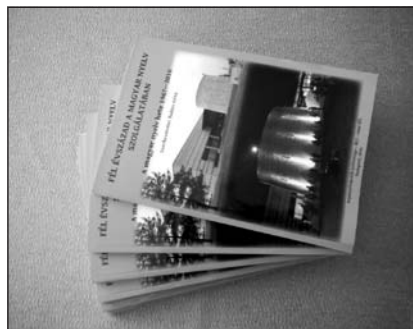
Az 50. magyar nyelv hete jubileumi kötete