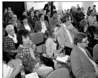
Az 50. magyar nyelv hete