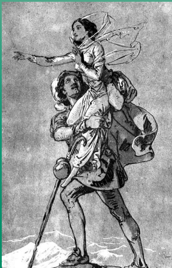
Zichy Mihály: Hegytetőn (tusrajz)

És: Pontozó, keresztretjtvény, új szavak